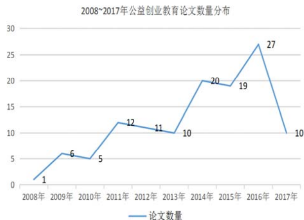
图1 公益创业教育文献期刊数量分布统计。

由图1可知, 2008到2010年间, 学者对这一领域已经进行研究但文献数量较少, 且增长趋势不明显。2014年开始则呈较明显的增长趋势, 仅2016年发表的文献数量已超过08至10年文章的总数, 但总的来说, 中国对于公益创业教育的研究还处于起步阶段, 随着政府和专家学者对公益创业教育这一新兴领域的持续关注, 对公益创业教育的各类研究也将逐渐深入。